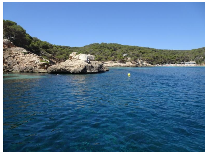
eine der zahlreichen Buchten der Insel

!!! Videos von BigBlueDiving – youtube !!!