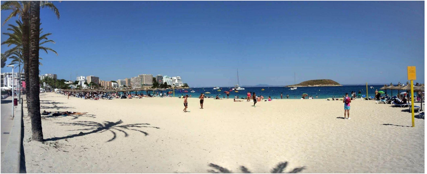
Strand von Magaluf – ca. 30 Gehminuten von Palmanova, hier gibt es auch viele Britische Kneipen ....