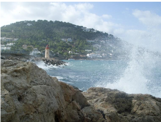
Kleiner Leuchtturm vom Hafen Port de Andratx