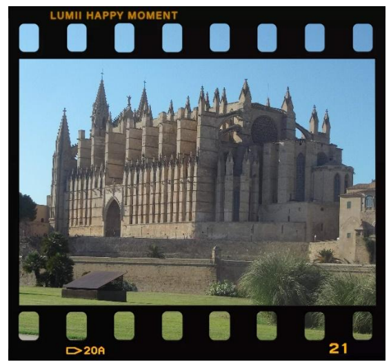
Kathedrale von Palma